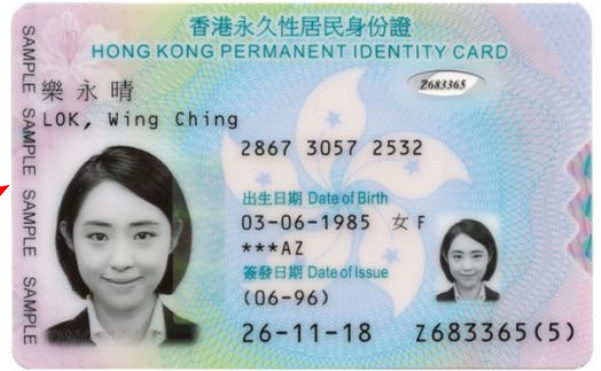
上載香港身分證(表面一版)含照片的正本影像